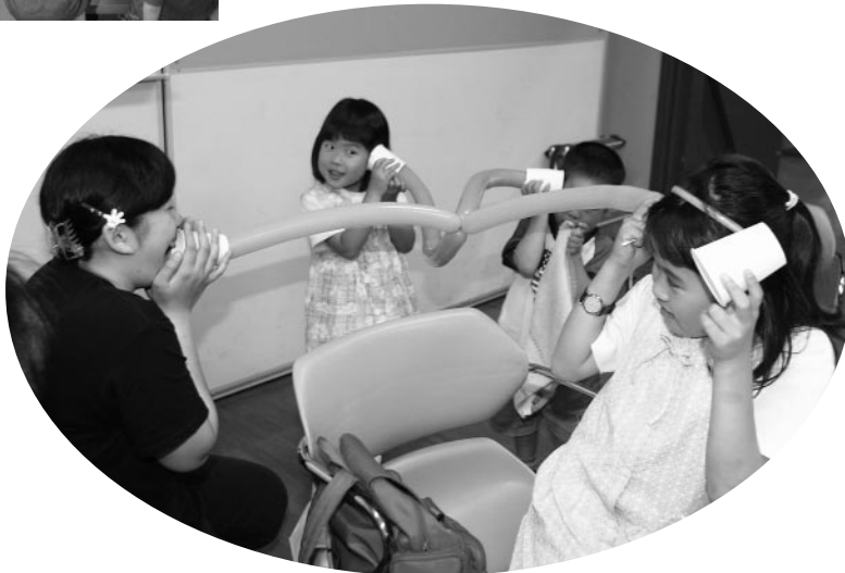
糸や針金、風船などでいろいろな電話を作り、楽しくおしゃべり

科学館 リフレクシユ理科教室 音の世界で遊ぼう! 五月二十六日、科学館で小・中学生を対象にリフレクシユ理科教室が開かれました。応用物理学会の協力で音に関する様々な実験工作や演奏会、体験コーナーなどが設けられ、参加した子どもたちは興味津々、目を輝かせながら一生懸命に取り組みました。