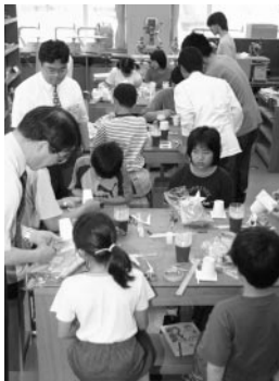
声を蓄える蓄音機づくり