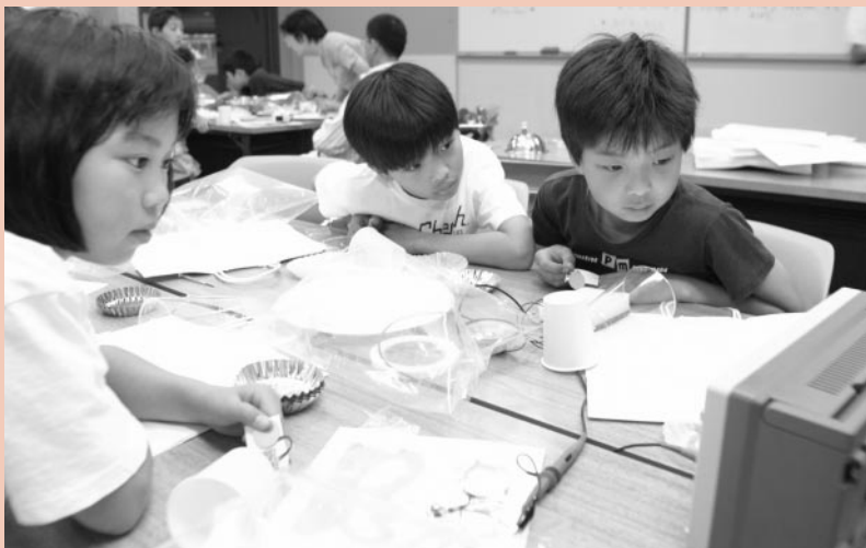
物の震え方と伝わり方で、聞こえる音の大きさが変わることを音波で確認