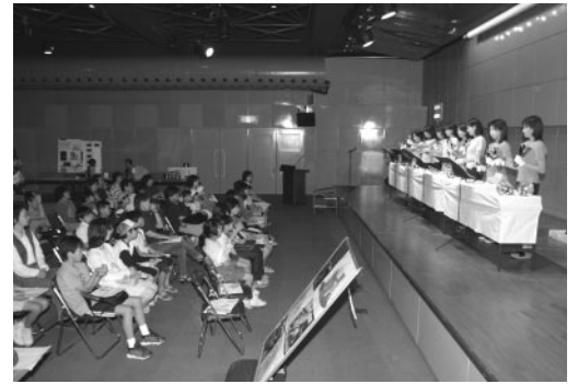
ハンドベルが奏でる美しい音色を堪能